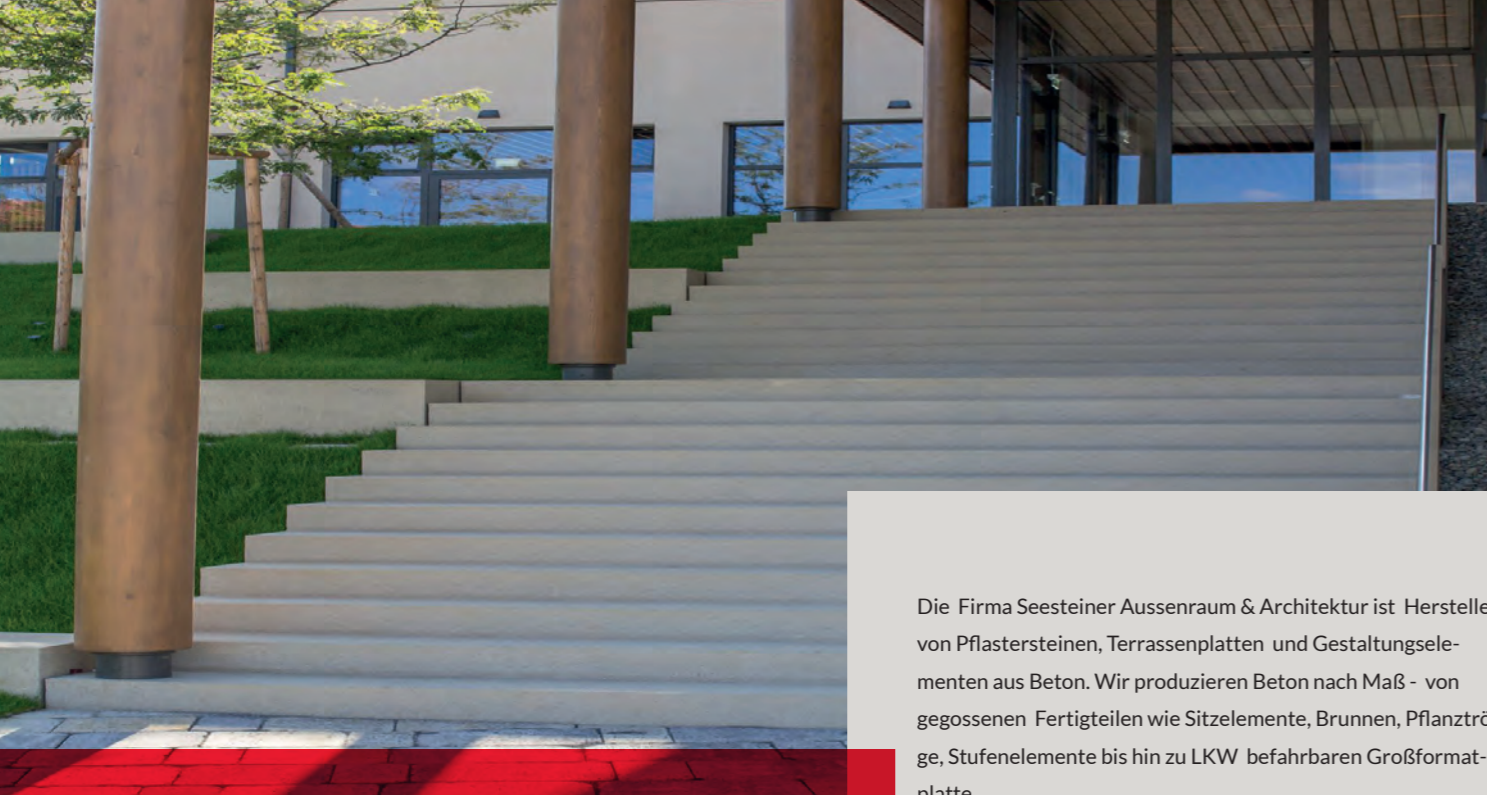
SASSO Fertigteiltreppen, grau-beige, edelgestrahlt

Die Firma Seesteiner Aussenraum & Architektur ist Hersteller von Pflastersteinen, Terrassenplatten und Gestaltungselementen aus Beton. Wir produzieren Beton nach Maß - von gegossenen Fertigteilen wie Sitzelemente, Brunnen, Pflanztröge, Stufenelemente bis hin zu LKW befahrbaren Großformatplatte.